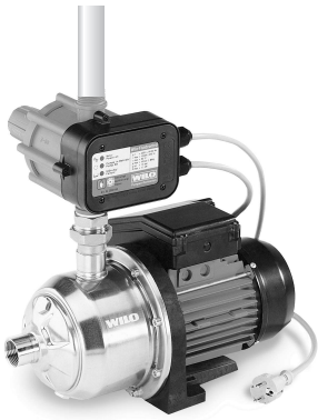
Direkt pompanın üzerine montaj