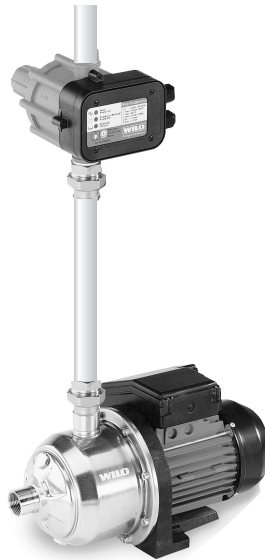
Basınç hattı üzerine montaj